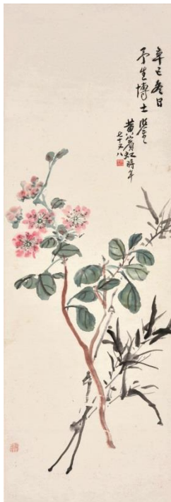
黃賓虹 (1865-1955) 花卉雙清 立軸 設色紙本 99 × 34 cm