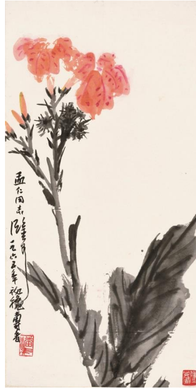
潘天壽 (1897-1971) 美人蕉 1965 年作 立軸 設色紙本 66.5 × 33 cm