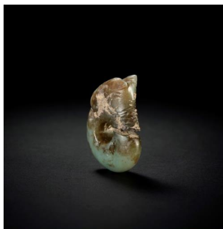
紅山文化 玉碾坑沁豬龍 來源： 盧芹齋的助手弗蘭克·卡羅先生舊藏，巴黎 杰拉德·瓦爾·迪特·博耶先生舊藏，巴黎 德國柏林私人珍藏 高 6 cm