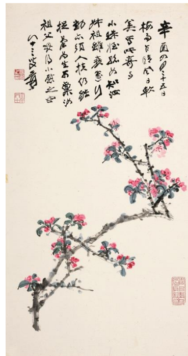
張大千 (1899-1983) 春日紅梅 辛酉 (1981 年) 作 立軸 設色紙本 69.5 × 37 cm