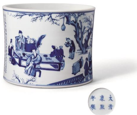
清康熙 青花春夜宴桃李圖筆筒 「大清康熙年製」六字三行楷書款 來源： 香港私人舊藏 直徑 19.5 cm

瓷器工藝品部秉持精益求精、一絲不苟的理念，繼續為廣大藏家遴選珍品。此次 2021 春拍，我們有幸得各大藏家繼續鼎力支持，將攜「觀古 I —— 中國古代玉器」、「觀古 II —— 金石文房藝術」、「觀古 III —— 瓷器」、「璧光盈袖 II —— 居易書屋珍藏玉器」以及「御品——帝苑奇珍」5 個專場，集瓷器、玉器、文玩雜項等挑選合計 800 餘件珍品與眾位藏家同好見面。揀選拍品重來源、重品相、重知識、重引導，從而展示出藏者於中國瓷器工藝品收藏的視野與情懷，文化與意趣，心得與體會，別開生面，以饗廣大藏友。