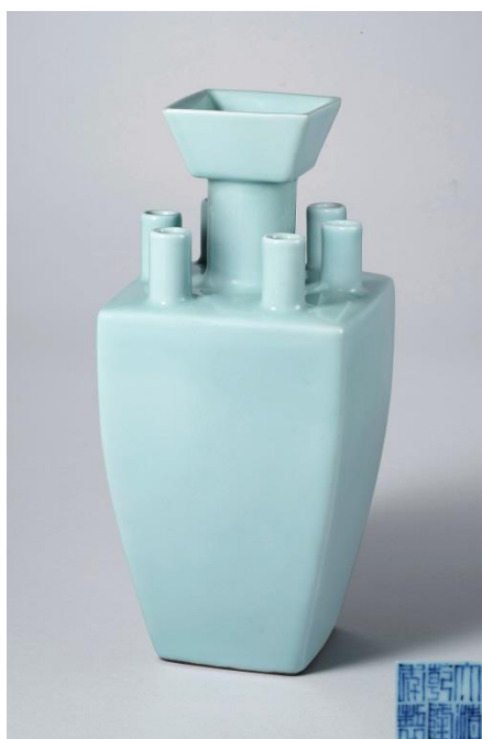
清乾隆 仿汝釉七孔盤口方瓶 「大清乾隆年製」六字三行篆書款 來源： 香港蘇富比，1991 年 10 月 29 日，拍品編號 84 香港佳士得，1992 年 9 月 29 日，拍品編號 538 香港佳士得，2004 年 11 月 1 日，拍品編號 1192 高 31.5 cm