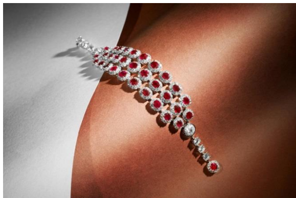
精美的總重量 16.74 克拉天然緬甸未經加熱鴿血紅 紅寶石配鑽石手鏈 售價：HK$400,000

瑰麗珠寶展售會「LUMIÈRE」率先為 2021 年度春季大拍揭開華麗序幕——將於 3 月 18 日至 31 日香港精品展期間，特別呈現逾 90 件優美雅致的珠寶珍品，彙集經典時尚的日常佩戴款式，到精湛卓越的彩色寶石、鑽石、翡翠及品牌古董，薈萃琳琅滿目的至臻佳品。本次春拍的珠寶鐘錶尚品部分將繼續以展售會取代傳統拍賣模式，為藏家們提供更精準的服務，體驗輕奢購買之樂。通過綺麗尚品的別致呈現，我們希冀能如「LUMIÈRE」的意涵「光」一般，為各位帶來珠寶的璀璨光芒，讓生活注入無限的美與能量。