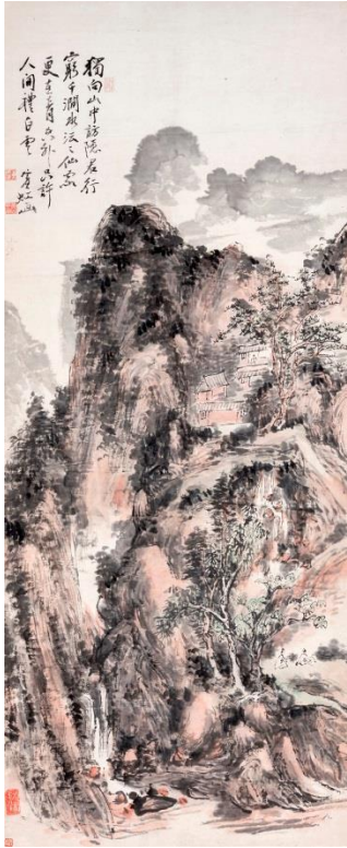
黃賓虹 (1865-1955) 獨向山中 立軸 設色紙本 95.5 × 38.5 cm