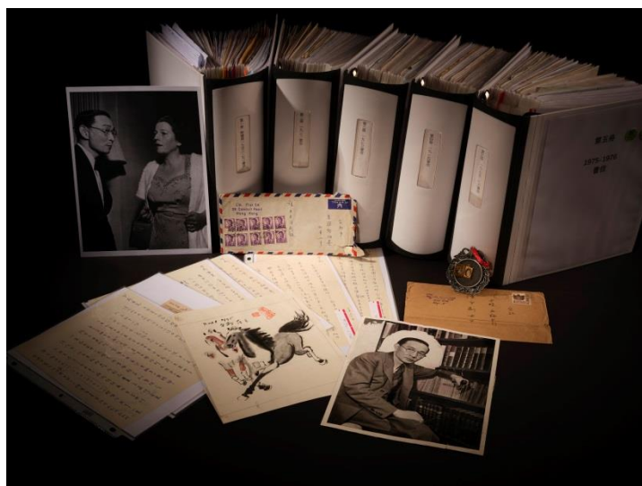
林語堂（1895-1976） 手跡碎金 信札、文獻及照片 近現代寫本 尺寸不一

自 2020 年春季拍賣起，中國嘉德連續兩季推出「故紙清芬見真如——林語堂手跡碎金」，均得到廣泛關注。今春得蒙藏家信賴，將所蓄林語堂先生故物和盤托出。此標的包括自 1948 年至 1976 年間，共 477 通、逾 678 頁林語堂先生手跡，以及自語堂夫人、相關友人 115 頁來函。作品數量與時間跨度，均為市場僅見。此間得窺林氏學術旨趣、交遊行止、情感糾葛，故紙清芬間時有靈光閃爍。可謂 1949 年後林語堂文獻的珍貴史料，亦是其「幽默與性靈」的絕佳範本。