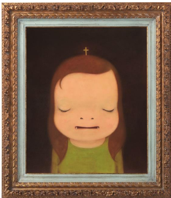
奈良美智 午夜吸血鬼 壓克力彩 畫布 2010 年作 73 × 60.5 cm 估價：HK$ 18,000,000 - 25,000,000

除此之外，還將呈現亞洲當代雕塑之星李真在拍賣史上前所未見的曠世巨作尺寸高達 248 公分的《大士騎龍》，精彩可期！