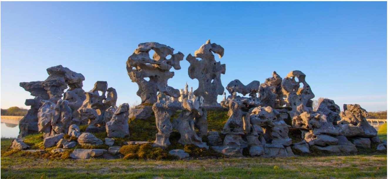
丘壑煙雲——青珊瑚（安徽省）| 1450 × 450 × 350 cm | 估價待詢