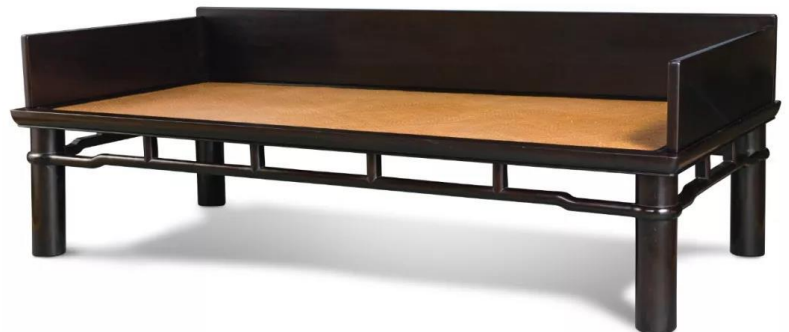
清早期 紫檀三圍無束腰圓腿羅鍋枱帶矮老羅漢床 197 × 95.5 × 65 cm 估價待詢