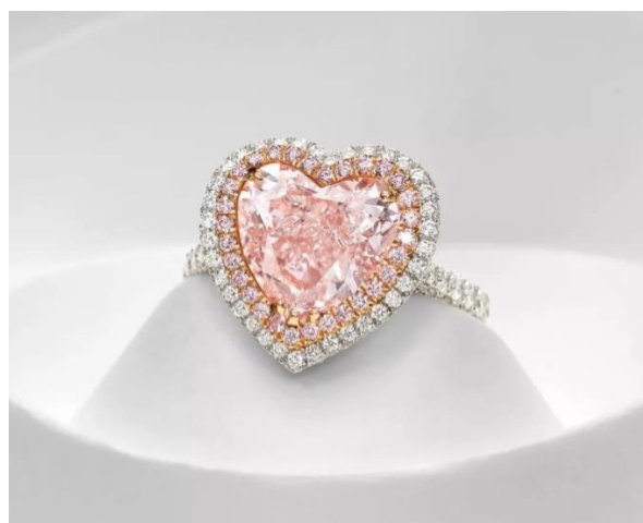
極為珍罕與瑰麗 4.58 克拉天然彩紫粉紅色 鑽石配鑽石戒指 估價待詢