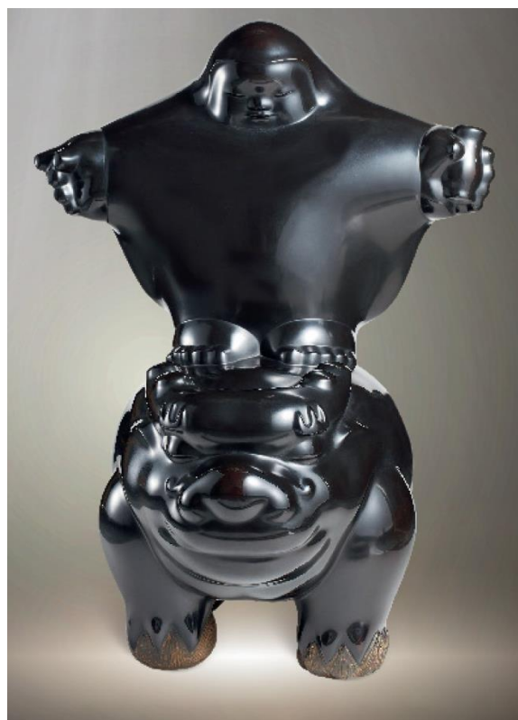
李真 大士騎龍 銅雕 版數: 5/6 2001 年作 248 × 163 × 196 cm 估價：HK$ 4,000,000 - 8,000,000