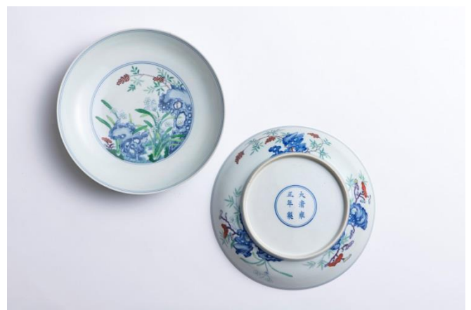
清雍正 鬥彩芝仙賀壽圖盤一對 「大清雍正年製」六字二行楷書款 直徑 20.6 cm 估價：HK$ 5,500,000 - 8,500,000