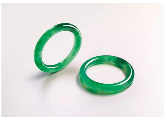
極為珍罕翡翠手鐲一對 亞洲重要藏家私人珍藏 估價待詢

鑽石方面，本季帶來一枚驚艷的 4.58 克拉天然彩紫粉紅色鑽石配鑽石戒指。心形的比例恰到好處，完美呈現出彩紫粉紅色的甜蜜。粉色鑽石收藏價值被廣大藏家所認可，且被全球市場與時間所驗證，為投資收藏的優質選項。