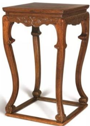
明 黃花梨四足香几 52.5 × 52.5 × 88.5 cm 估價：HK$ 2,600,000 – 3,600,000