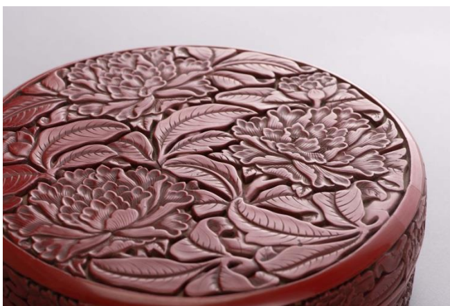
明永樂 剔紅牡丹紋盒 「大明永樂年製」款 直徑 22 cm 估價：HK$ 5,000,000 - 8,000,000

是次秋拍有幸得各大藏家繼續鼎力支持，瓷器工藝品部分將設「觀古——瓷器珍玩工藝品」、「應物希古——中國古代陶瓷」、「瓊玉蒼素——美國舊金山私人珍藏古玉遺產拍賣II」、「玄禮四方——中國古代玉器」、「妙物心鑒——中國古代藝術之美」及「古道新輝——香港鄧氏家族舊藏民國瓷藝」共6大專場，挑選合計700餘件珍品與眾位藏家同好見面。揀選拍品重來源、重品相、重知識、重引導，從而展示出藏者於中國瓷器工藝品收藏的視野與情懷，文化與意趣，心得與體會，別開生面，以饗廣大藏友。