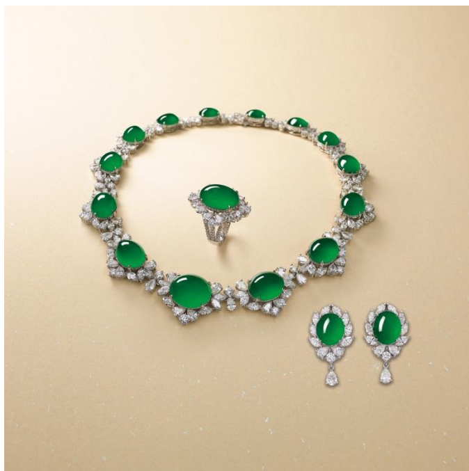
極為珍罕與瑰麗精美翡翠配鑽石項鍊、耳環 及戒指套裝 亞洲重要藏家私人珍藏 估價待詢